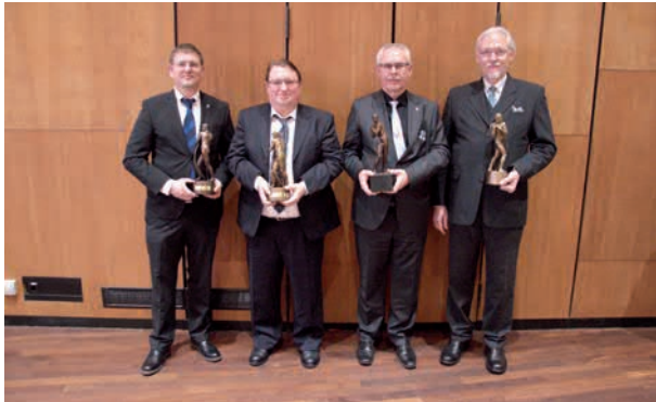
Die Gewinner der Bogenschützen