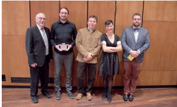
Die Gesellschafts- meister Pistole