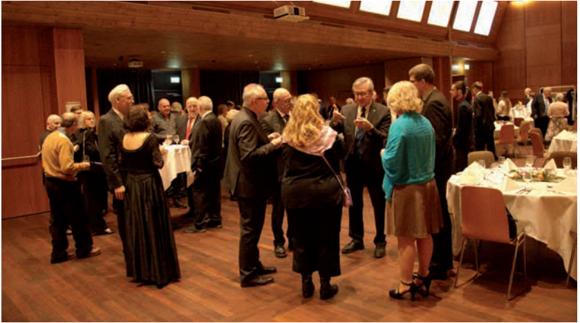
Am Apéro wird genossen und viel diskutiert