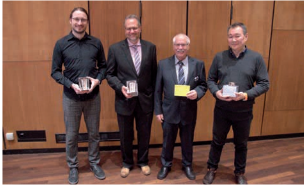
Alle Gesellschafts- meister vereint