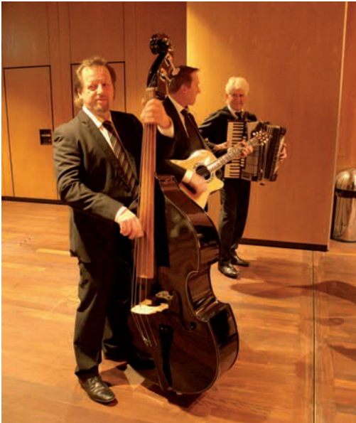
Die hgh Band im Einsatz