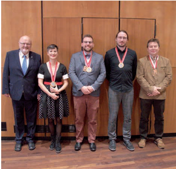
Die erfolgreichen Pistolen-Gruppen- schützen an CH- Meisterschaften