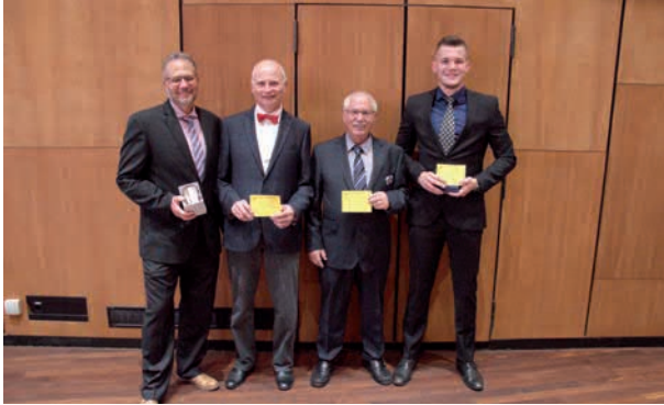
Die Gesellschafts- meister 300 m