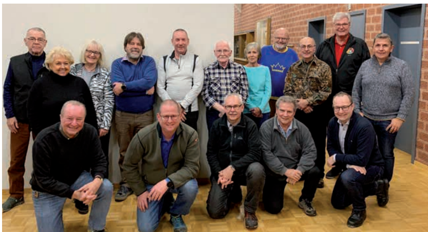
Den Helfern sei herzlichst gedankt! Das Dream-Team!