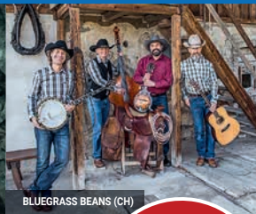
BLUEGRASS BEANS (CH)