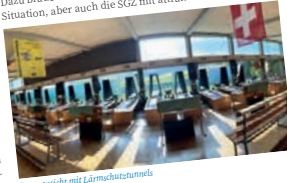
Innenansicht mit Lärmschutztunneln

Nicht wenige Schützinnen und Schützen haben in den letzten beiden Jahren, durch CoVid-19 verunsichert, dem Schiesssport den Rücken gekehrt. Diese gilt es zurückzuschicken; sei es als aktive Schützinnen und Schützen, gewinnen; sei es als aktive Schützinnen und Schützen, engagierte Funktionäre oder uns wohlgesinnte Gönner. Dazu braucht es allerdings zuerst eine Normalisierung der Situation, aber auch die SGZ mit attraktivem Umfeld.