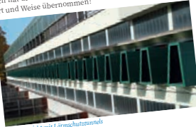
Ausschnittsicht mit Lärmschutztunneln

Im Oktober wurden in der 300m-Anlage alle 43 Läger mit grossen Lärmschutztunnels, die auch das Schiessen eines Dreistellungsmatches erlauben, ausgerüstet. Die Stadt Zürich hat die entsprechenden Kosten in verdankenswerter Art und Weise übernommen!