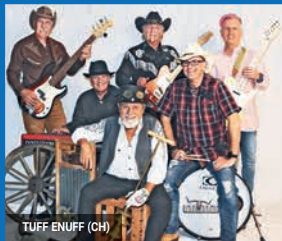
TUFF ENUFF (CH)

auf der der Donau vom 11. - 18. September 2022 mit der MS Thurgau Silence