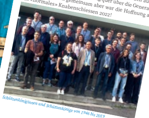
Schützenköniginnen und Schützenkönige von 1946 bis 2019

Der Anlass war ein voller Erfolg. Es wurde viel gelacht, Erfahrungen aus unterschiedlichen Epochen wurden ausgetauscht und man diskutierete eifrig quer über die Generationen hinweg. Allen gemeinsam aber war die Hoffnung auf ein «normales» Knabenschiesen 2022!