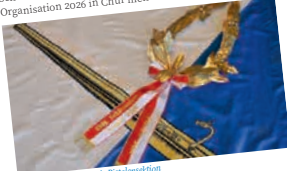
Goldlorbeerkrone für die Pistolenaktion

in der Messe Luzern mehrstündige Wartezeiten die Regel waren, erforderte seitens der beteiligten Schützinnen und Schützen viel Geduld und Verständnis. Hoffentlich hat die Organisation 2026 in Chur mehr Fortüne.